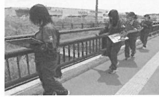
国土交通大臣賞 日本大学大学院工学研究科