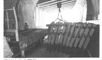
農林水産大臣賞 石川県農林水産部森林管理課