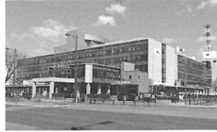
国土交通大臣賞 青森県