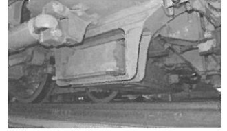
国土交通大臣賞 公益財団法人鉄道総合技術研究所