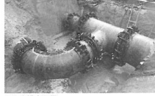
厚生労働大臣賞 大成機工(株)