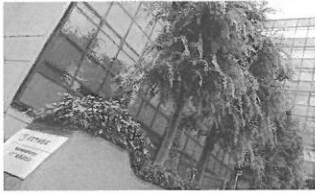
総務大臣賞 (株)NTT東日本-南関東