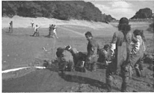
農林水産大臣賞 淡路東浦ため池♡里海交流保全協議会