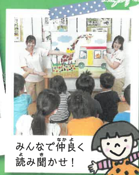
みんなで仲良く読み聞かせ！