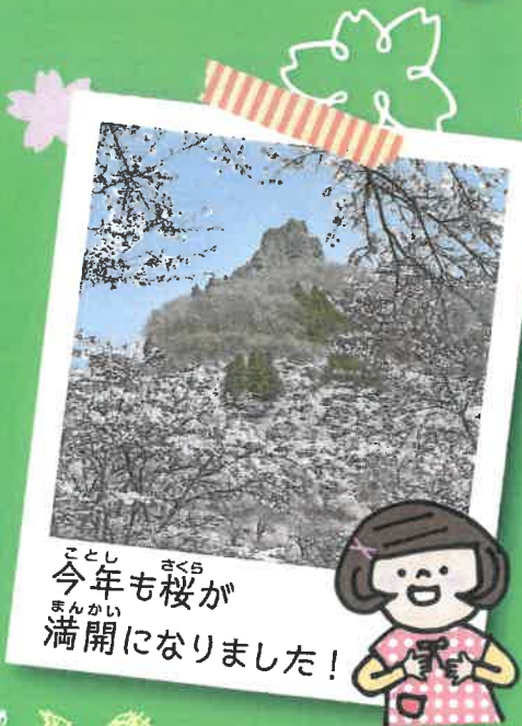
今年も桜が満開になりました！