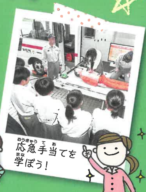
応急手当てを学ぼう！