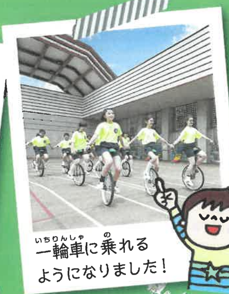
いちりんしゃの輪車に乗れるようになりました！