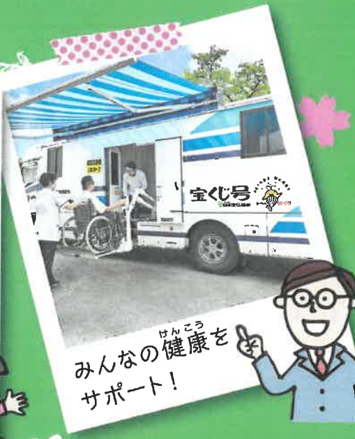
みんなの健康をサポート！