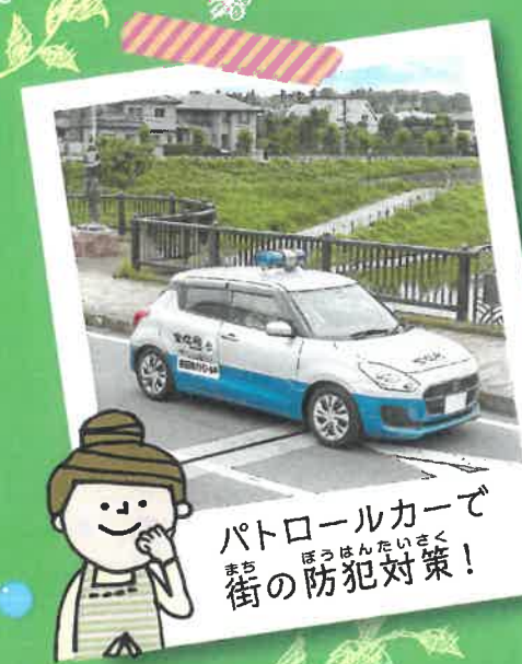
パトロールカーでまちの防犯対策！