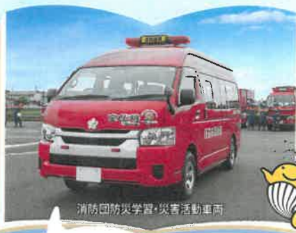
消防団防災学習・災害活動車両