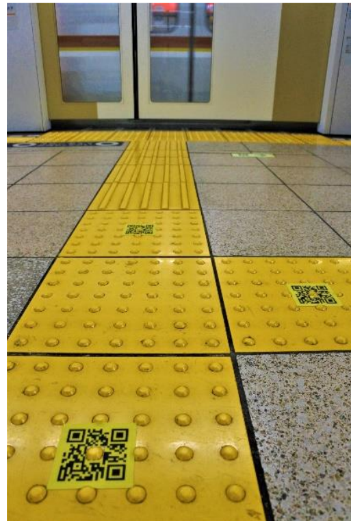
QRコード設置イメージ