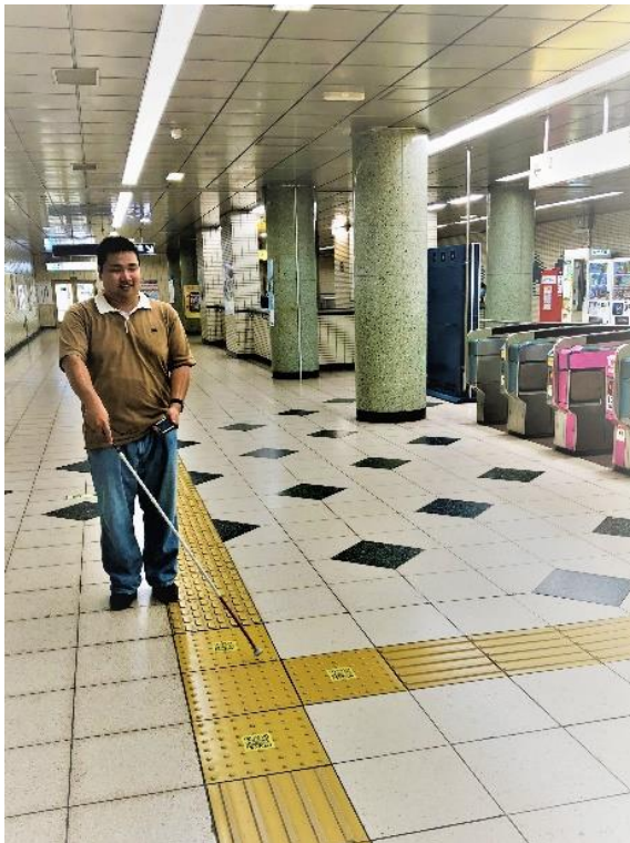
実証実験イメージ