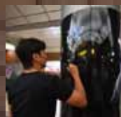
2016年9月29日の現役ラスト登板に際し、日本大通り駅の柱にサイン