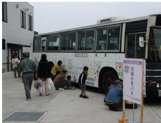
※写真はすべてイメージです。