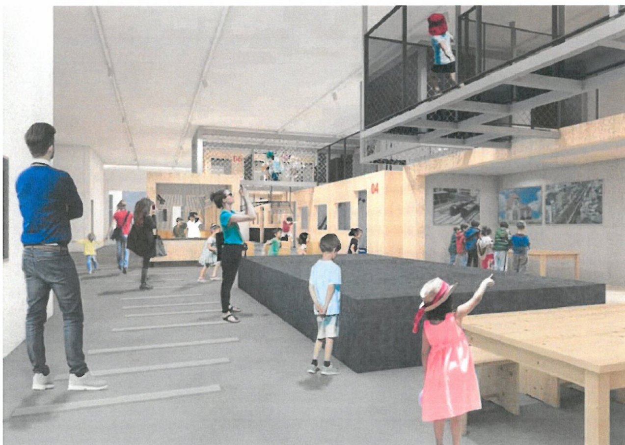
キッズゾーンイメージ