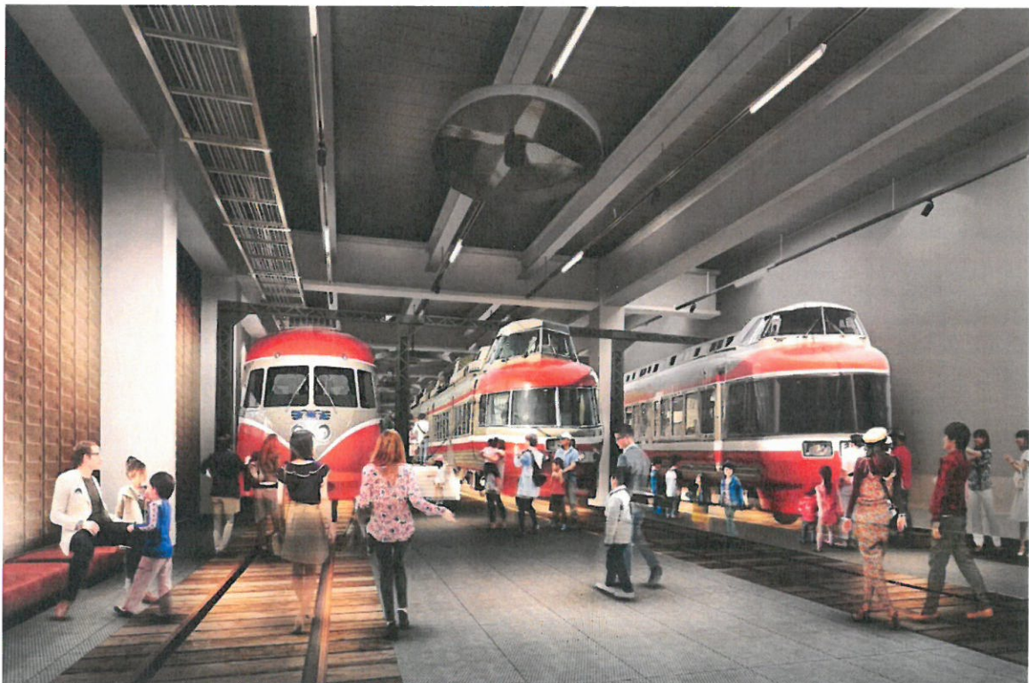
歴代の特急ロマンスカー車両展示（イメージ）

このロマンスカーミュージアムの開業予定地は、鉄道の重要拠点である海老名電車基地と新たにエリア開発が進む「VINA GARDENS」にも隣接しています。小田急線開業以来初となる鉄道ミュージアムの建設により、小田急線の歴史を後世に伝えていくとともに、新しく誕生する街のシンボルとして、新たな賑わいを創出します。