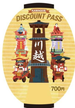
△提灯の形をした「KAWAGOE DISCOUNT PASS」（大人用）券面 （約8cm×約12cm）（イメージ）