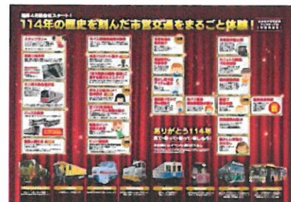
ちらし中面(画像クリックでPDFを表示します)