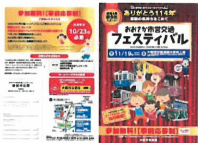
ちらし表面(画像クリックでPDFを表示します)