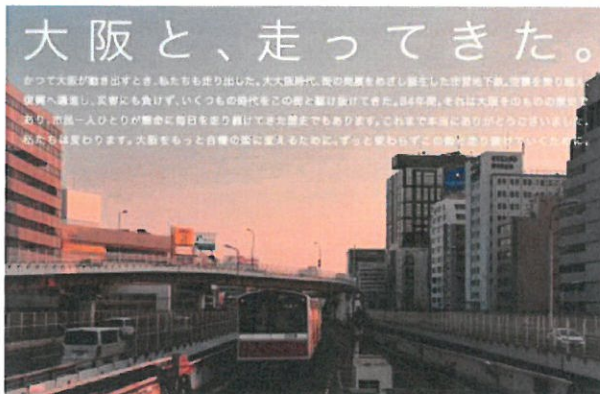
ポスターデザインの一例