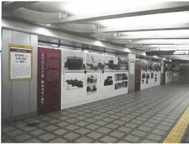
歴史パネル展実施状況