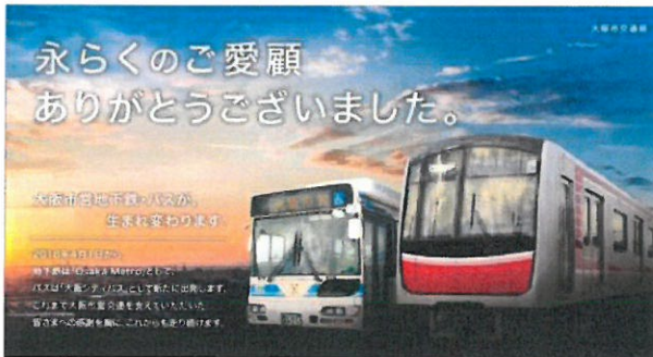
ノベルティ添付デザイン

内容:地下鉄及びバスの事業に従事する様々な職種の職員が、お客さまにノベルティを配布します。