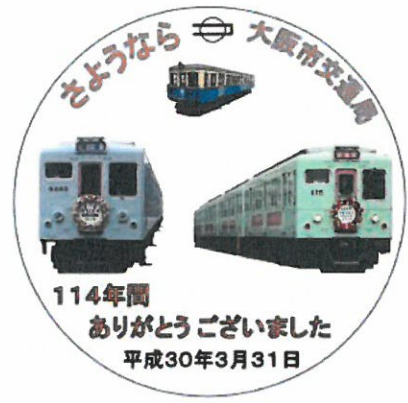
サヨナラヘッドマーク