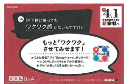
第3弾ポスター(平成30年2月下旬～3月中旬)