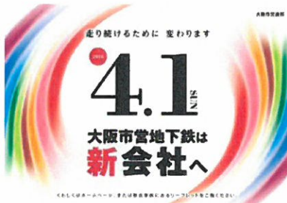
第1弾ポスター(平成30年1月)