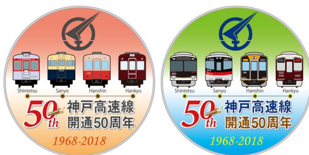
ヘッドマークイメージ