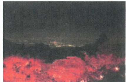
秋の紅葉が美しい「大山」地区の様子