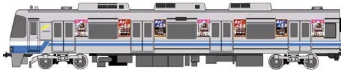
<「走れ! 山笠号イメージ」>