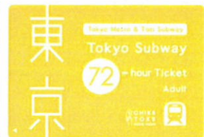
Tokyo Subway Ticket(イメージ)