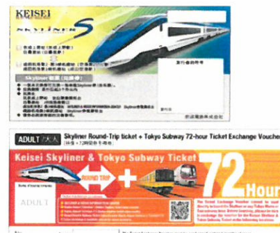
写真左: 京成スカイライナー、写真右上: スカイライナークーポン(引換券)イメージ 写真右下: Keisei Skyliner & Tokyo Subway Ticket(引換券)イメージ