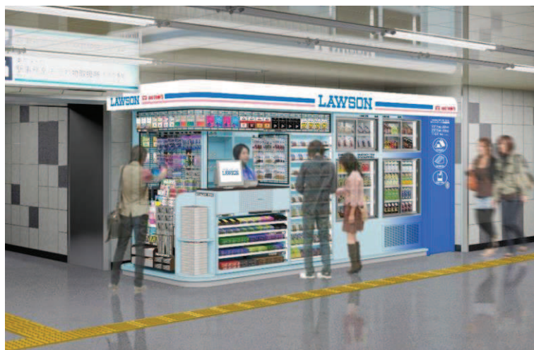
【「ローソンメトロス秋葉原店」イメージ図】

3社は2020年に向け、増加する外国人観光客に向けたサービスや情報発信、商品の品揃えなどで協力し、首都の支えるインフラとしての機能を向上させた新しいスタイルの駅ナカコンビニを構築してまいります。