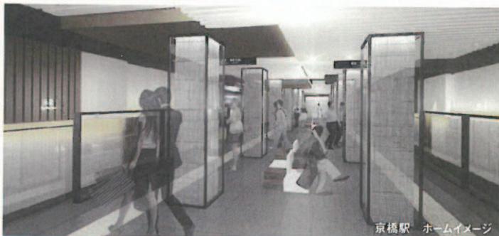
京橋駅 ホームイメージ