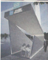
日本橋駅 出入口イメージ

各駅の空間を「時：経験と未来」「街：発展していく街」「物：継承されるもの」「心：温められる心」の共通するテーマが詰まったギフトボックス(PACK-AGE)と見立てることで、駅が街の「伝統や歴史」と「近代商業地域」の架け橋となり、人々に新たな時代への期待感を膨らませます。