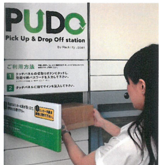
荷物取り出しの様子