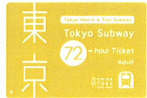
Tokyo Subway Ticket(イメージ)