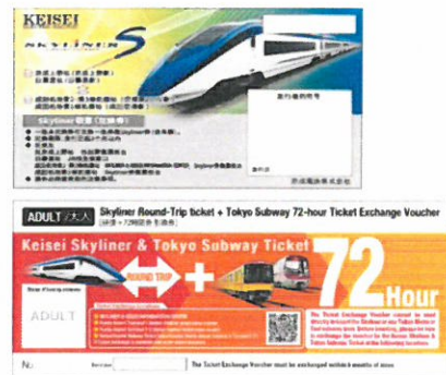
写真左：京成スカイライナー、写真右上：スカイライナークーポン(引換券)イメージ 写真右下：Keisei Skyliner & Tokyo Subway Ticket(引換券)イメージ