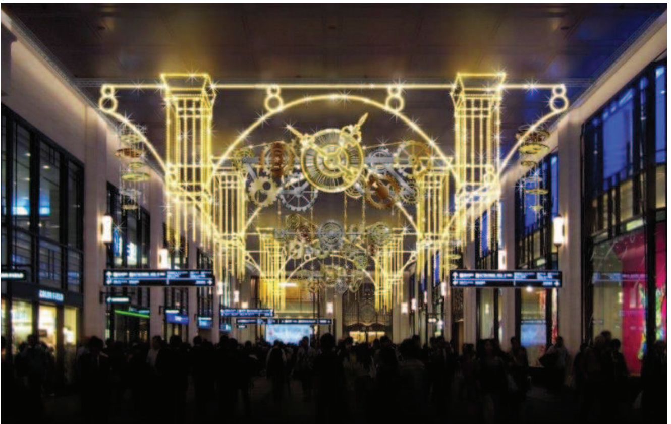
クリスマス・イルミネーション「0号線のPLATFORM」イメージパース

阪急電鉄では、梅田阪急ビル1階(阪急百貨店うめだ本店前)の南北コンコースで、過去3年にわたって実施してきた内容を一新し、新たにクリスマス・イルミネーション「0号線のPLATFORM」を開催します。