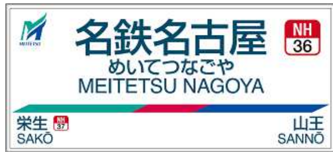
【例3】駅名標イメージ(名古屋本線 名鉄名古屋駅)