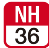
【例1】 名古屋本線 名鉄名古屋駅