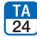
【例2】 空港線 中部国際空港駅