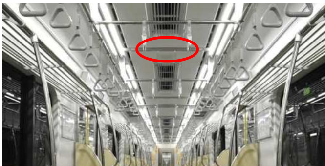
設置位置イメージ