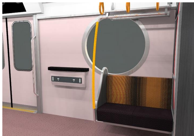
車端部の丸窓、テーブル、荷物掛け、コンセント