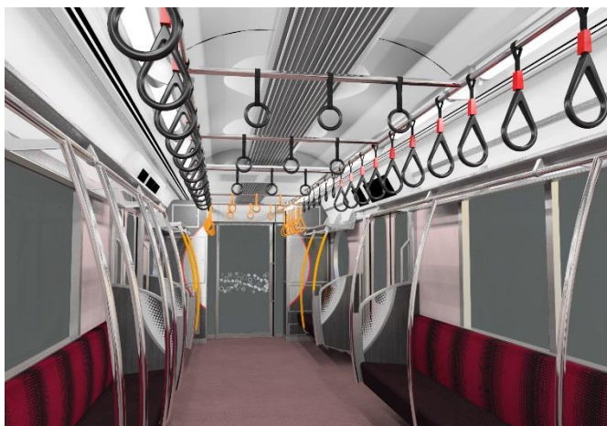
丸ノ内線 2000 系車両内観