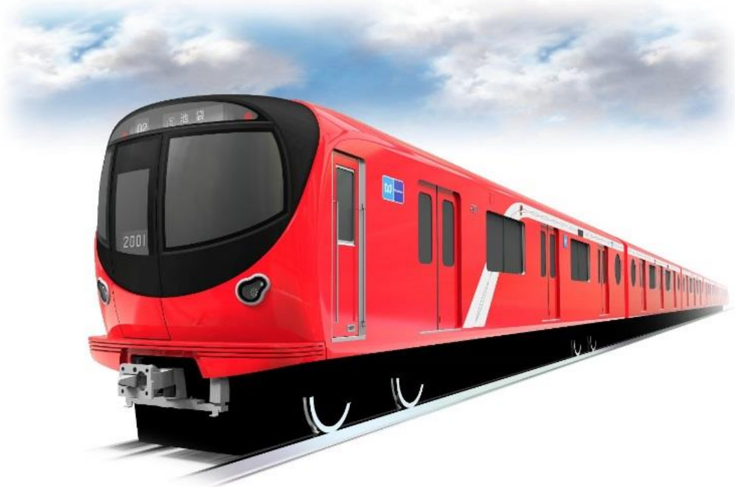
丸ノ内線 2000 系車両外観

東京メトロは、これからも引き続き、安全・安定運行に向けた取り組みを進めてまいります。 詳細については別紙をご参照ください。