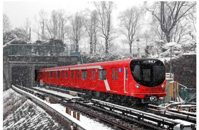
四ツ谷駅付近での走行イメージ