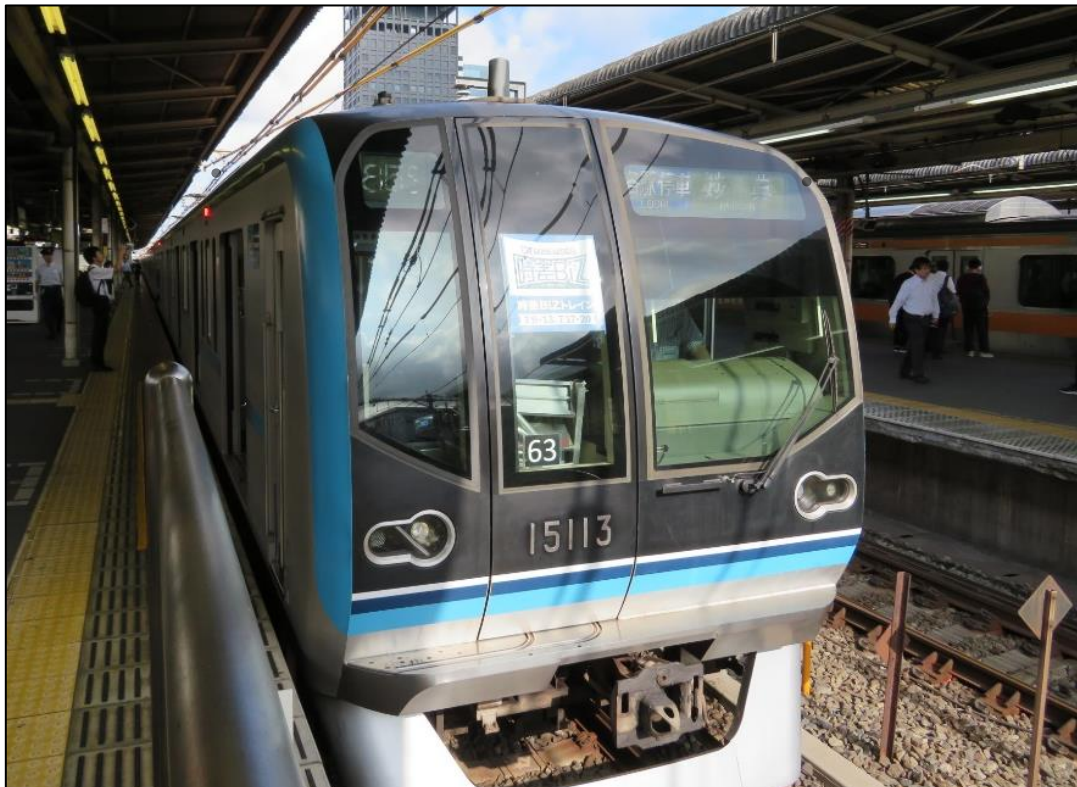
臨時列車として運行する東西線 15000 系（2018 年夏季運行の様子）