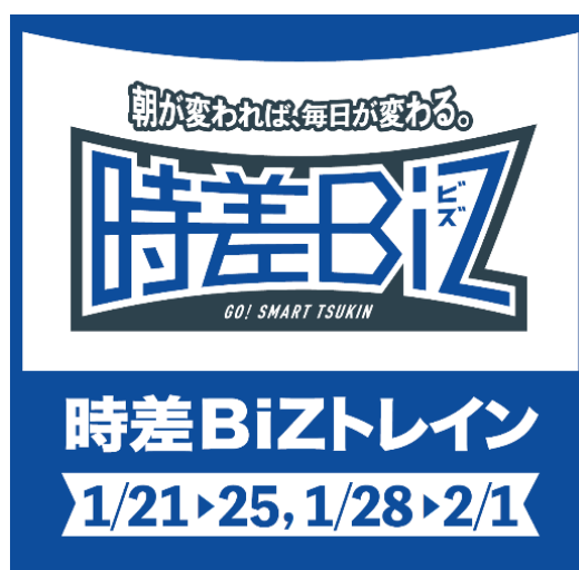
東西線時差 Biz トレインヘッドマーク (イメージ)