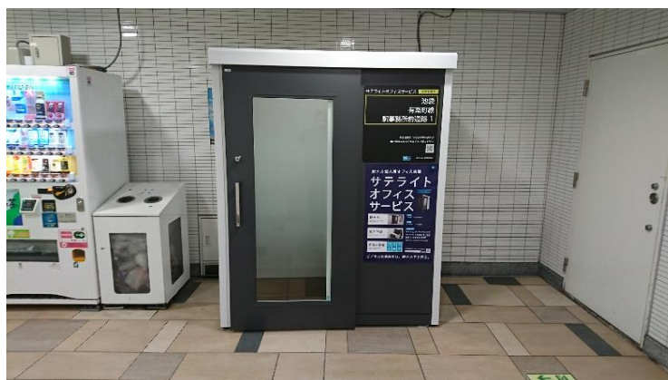
ワークブース外観(有楽町線池袋駅構内)

詳細は、サテライトオフィスサービス特設Webサイト( https://wpss.jp/lp/ )をご覧ください。