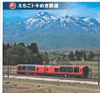
えちごトキめき鉄道