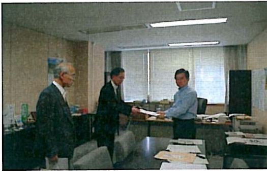
②国土交通省への要望(田端審議官への説明)