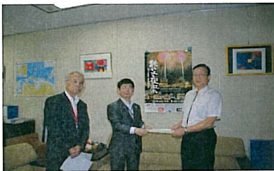
②同省・村中審議官への要望