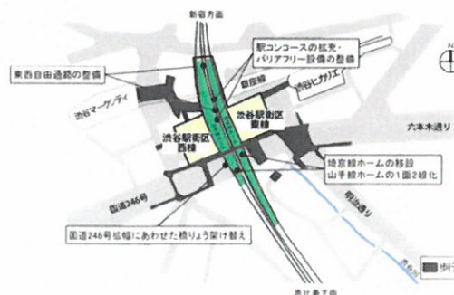
(JR 埼京線渋谷駅移設図)

あつた7基の橋脚を3基に集約し、明治通りの交通障害を改善するなどの大規模な工事で、地下鉄工事としては異色の工事でした。