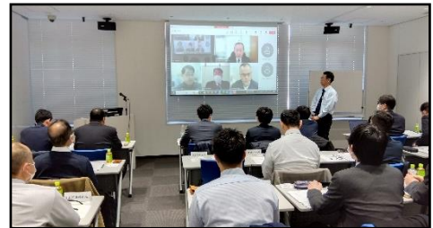
(Web 併用会議の開催状況)

土木部会では、「トンネルなど土木構造物の劣化状況の判定と予防保全手法」をテーマに研究を進めており、今回は、これまでの研究課題である「鉄道トンネルの維持管理」(第1部)に加え、近年の多発する自然災害、特に地震等の発生を踏まえ各社局でも関心の高い「耐震補強対策」(第2部)についても研究しました。