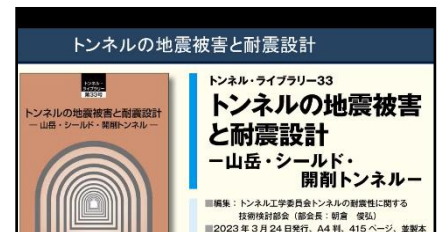
(中央復建室谷様発表状)

時間の関係上、耐震設計の変遷と被害事例について要点を簡潔に取りまとめ、わかりやすく説明いただきました。後半の、開削トンネル、シールドトンネル及び山岳トンネルの3工法の変形の違いについての試計算では、シールド及び山岳トンネルの部材の変形角が開削トンネルより小さいとの興味ある試計算結果が報告されました。