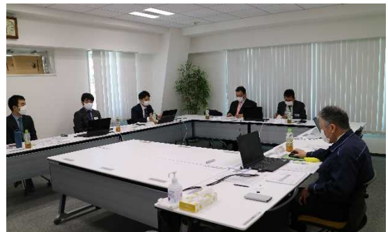
9階会議室での会議の状況

また、先行してリニア地下鉄以外の車両で検査周期の延伸に取り組んでいる大阪メトロ、横浜市、仙台市から、周期延伸終了後の状況について説明があり、各社局ともに概ね順調に進行している状況が伺われました。