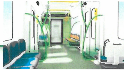
車内イメージ(公園)