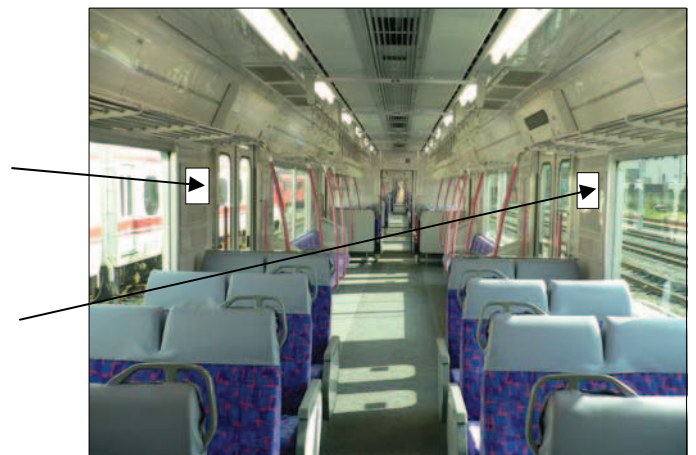
3300系車両 車内イメージ