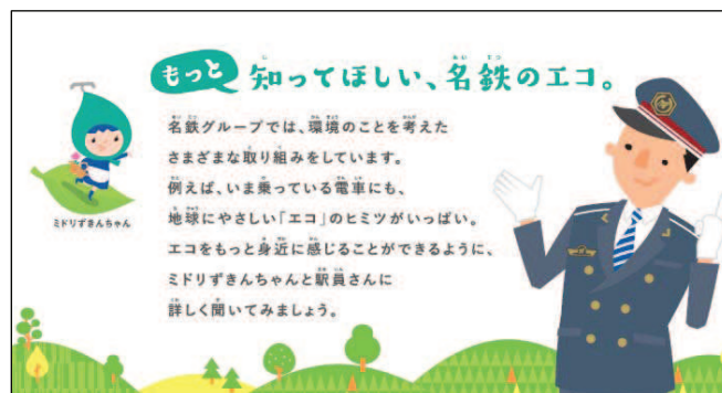
車内広告イメージ